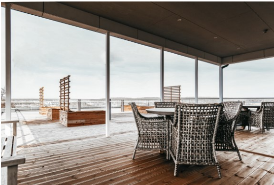
Takterrass med spaljéer, odlingslådor och fantastisk utsikt