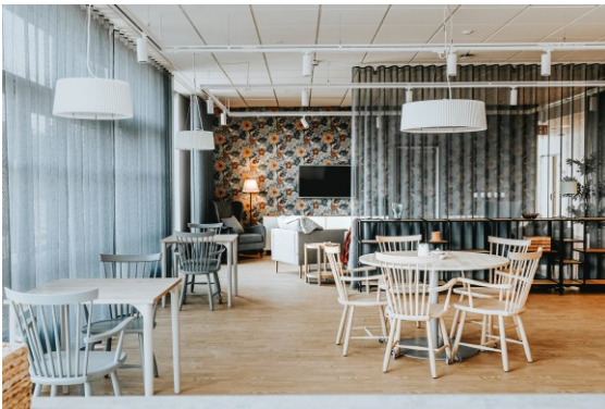
Matsal och vardagsrum som delas av 10 personer

Sociala utrymmen som finns på varje våning