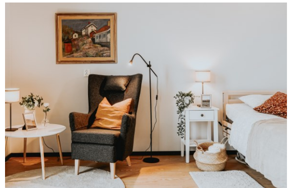
Läshörna och säng med nattduksbord