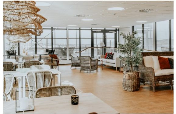
Vinterträdgård – Perfekt för konserter, pubkvällar, odlingskurser, bullbakning eller födelsedagsfirande med nära och kära.