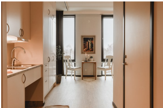
Kokvrå och matbord i visningslägenheten