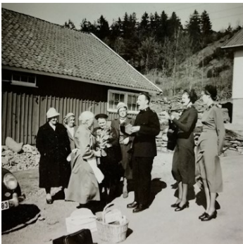
Frälsningsarmén på besök 1958

AvAsta har ett mycket långsiktigt perspektiv och för oss är det självklart att utvecklas och utveckla. Vi är en lärande organisation med kontinuerlig fortbildning som skapar förutsättningar för att göra ett förstklassigt arbete. För att leva upp till våra intressenters och våra egna högt ställda förväntningar, arbetar vi ständigt och systematiskt med kvalitetsarbete i alla led. Att förbättra vårt arbetssätt och att medarbetarna ska utvecklas kontinuerligt är essentiellt för oss. Årliga mätningar av kvaliteten har länge utförts och redovisas kvalitetsbokslut. Vårt mål är att skapa förutsättningar för ett mer självständigt liv för de som bor på våra boenden. Vi strävar efter att skapa hemtrevliga miljöer, servera god mat och erbjuda möjlighet till aktivitet eller andra upplevelser som får de som bor hos oss att längta, uppleva och känna. Vi vill öka mångfalden och understödja kommuner i arbetet med att möta det ökande behovet av attraktiva äldreboenden.