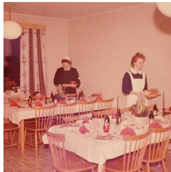
Dukning för julmiddag 1961